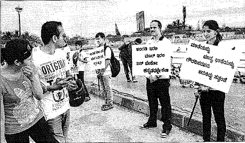
'ನಗರದ ಕಂಕಣ ನಾಡು-ನುಡಿಗಾಗಿ' ಸಂಸ್ಥೆಯ ಸದಸ್ಯರು ಭಾನುವಾರ ಸ್ವಾಂಕಿ ಕರೆಯ ವಾಯುವಿಹಾರಿಗಳಿಗೆ 'ಕನ್ನಡ ಮಾತಾಡಿ' ವಿಶೇಷ ಅಭಿಯಾನ ನಡೆಸಿದರು.