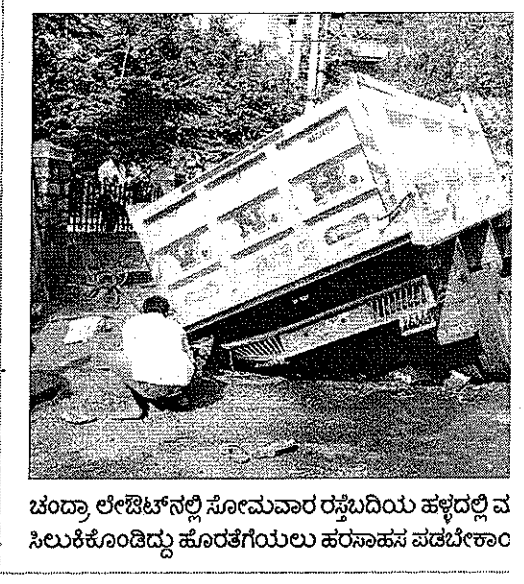
ಬೆಂಗಳೂರು ಲೇಔಟ್‌ನಲ್ಲಿ ಸೋಮವಾರ ರಸ್ತೆಬದಿಯ ಹಳ್ಳದಲ್ಲಿ ವಿಸ್ಫೋಟಗೊಂಡಿದ್ದ ಹೊರತೆಗೆಯಲು ಹರಸಾಹಸ ಪಡಬೇಕೆಂದು