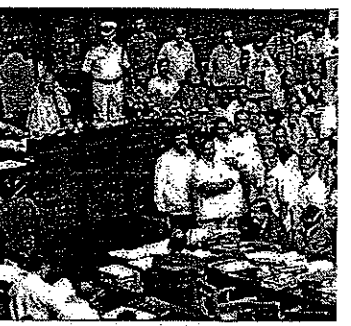
ವಿಧಾನಸಭೆಯಲ್ಲಿ ಸಿಎಂ ಬಜೆಟ್ ಅಧಿಕಾರಿಗಳಿಗೆ ವಿಧೇಯರ ಭರ್ವಣಿ ಕಾರ್ಯಕ್ರಮದ ಅಂಗವಾಗಿ ನಡೆಯಿತು.

■ ಬಿಜೆಪಿ ಭರ್ವಣಿ ಕಾರ್ಯಕ್ರಮದ ಅಂಗವಾಗಿ ನಡೆಯಿತು. ಅಂತಿಮ ಬಜೆಟ್ ಅಧಿಕಾರಿಗಳಿಗೆ ಬಿಜೆಪಿ ಭರ್ವಣಿ ಕಾರ್ಯಕ್ರಮದ ಅಂಗವಾಗಿ ನಡೆಯಿತು.